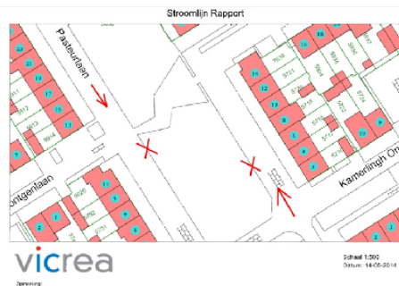
Figuur 1. Plaatsen van snelheidsmetingen.

Na melding van bewoners over te hard rijden zijn er gedurende meerdere weken snelheidsmetingen verricht op de Pasteurlaan en de Einsteinlaan. Hieronder staan de resultaten met een toelichting en conclusies, alsmede enkele aanbevelingen over de invoering waarvan de wijkvereniging met de gemeente zal overleggen.