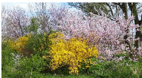
Voorjaar in Noord