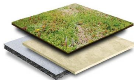
Voorbeeld van een groendak, de opbouw en de aanleg.