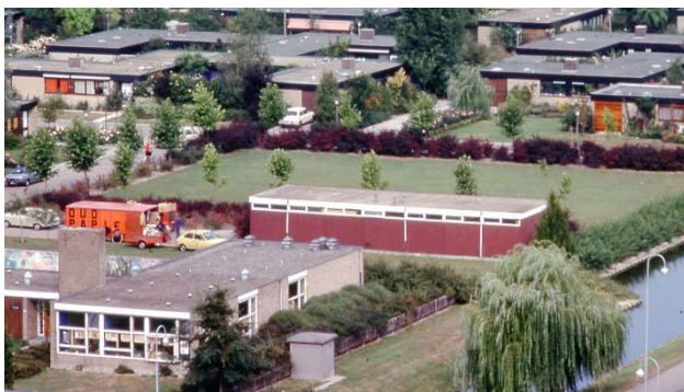
Het houten clubgebouw gezien vanuit de RK-kerk

Gelukkig had de hervormde kerk in Noord aan de rand van Park Berkenoord tegenover de Vuurdoornlaan een stuk grond beschikbaar. De hervormde gemeente had die grond in 1964